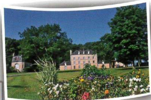
Domaine de Pont-Ramond