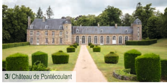
3/ Château de Pontécoulant