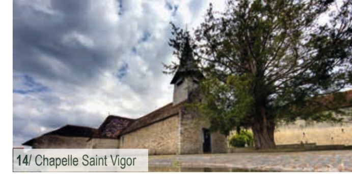
14/ Chapelle Saint Vigor