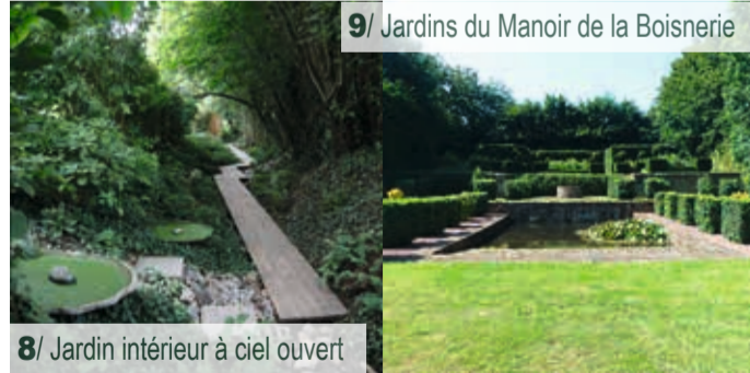
7/ Jardins du Manoir de la Boisnerie