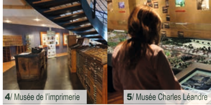
4/ Musée de l'imprimerie