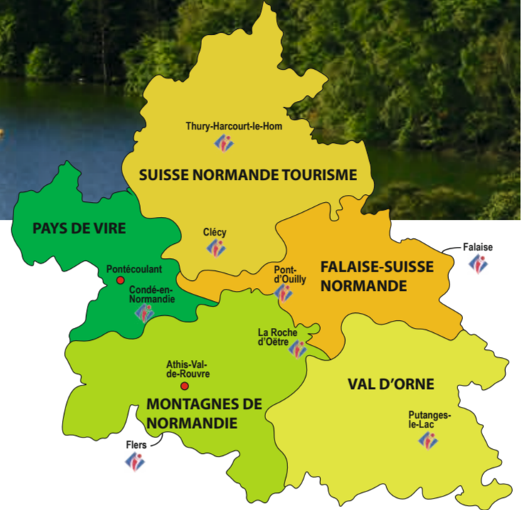
La Suisse Normande, cinq territoires : une destination !