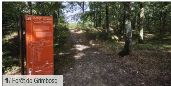
1/ Forêt de Grimboisq