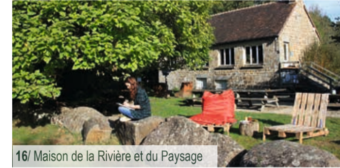
16/ Maison de la Rivière et du Paysage