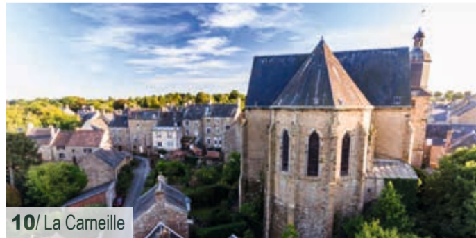
8/ Jardin intérieur à ciel ouvert