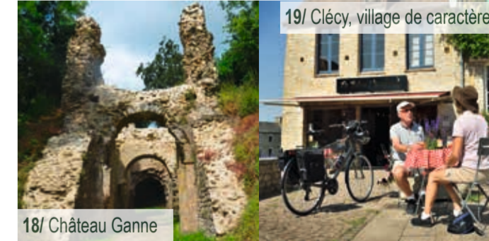
18/ Clécy, village de caractère