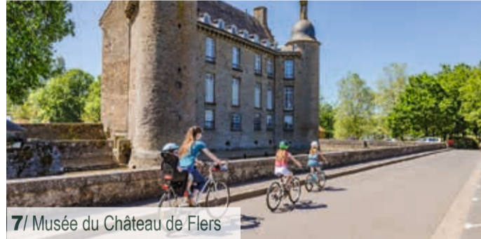
6/ Mont de Cerisy