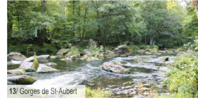
13/ Gorges de St-Aubert