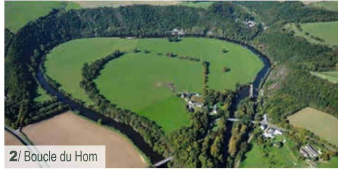
2/ Boucle du Hom