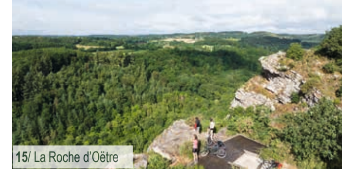
15/ La Roche d'Oëtre