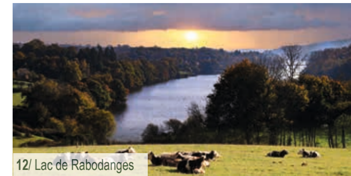
12/ Lac de Rabodanges