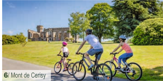
5/ Musée Charles Léandre