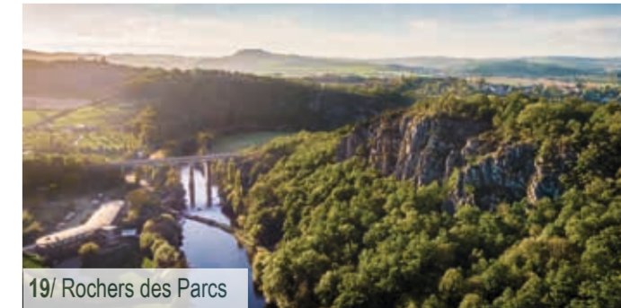
19/ Château Ganne