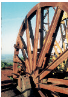
L'ancienne roue du puits appelée « molette »