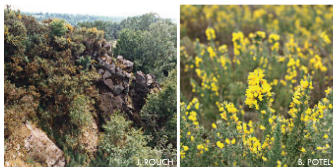
La Vallée de la Varenne et ses escarpement de grès armoricain qui se colore vivement en avril, au plus fort de la floraison des joncs d'Europe.

À seulement quelques mètres de ce lieu de culte pittoresque, le promeneur peut s'aventurer sur des escarpements de grès, au milieu d'une lande à bruyères et ajoncs. De ce point de vue, les paysages y sont saisissants. Les épais boisements recouvrant la pente laissent à peine deviner que la Varenne, rivière affluente de la Mayenne, serpente en contrebas.