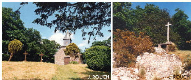
La Chapelle des Roches et les vestiges du cimetière de l'ancienne église du Châtellier : quelques tombes, de vieux ifs et, à l'entrée du site, une ancienne croix hosannière en granit.

Un camp romain occupait déjà ce lieu stratégique il y a plus de 2000 ans. De construction sobre, à partir de matériaux de pays, la Chapelle des Roches n'a été érigée qu'en 1847. Mais elle représente le plus ancien site de pèlerinage de l'Orne, puisque construite sur les ruines de l'ancienne église du Châtellier, déjà dédiée à la Vierge depuis le Haut Moyen-Age.