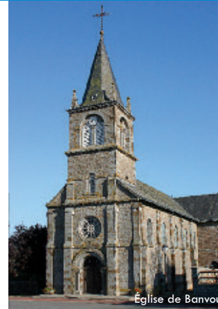
Église de Banvou

Sinon : marcher tout droit jusqu'au lieu-dit «Pic-Louvette», traverser puis tourner à droite après 50 m. De retour sur la route, l'emprunter sur la gauche. Ensuite, prendre 1 er chemin de terre à gauche. À la route, tourner à droite.