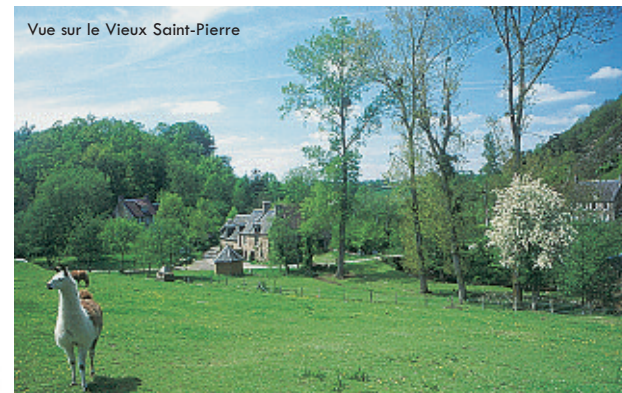
Vue sur le Vieux Saint-Pierre