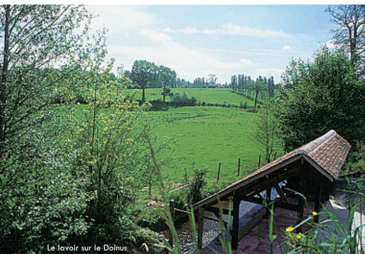
Le lavoir sur le Doinus