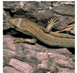
Lézard des murailles