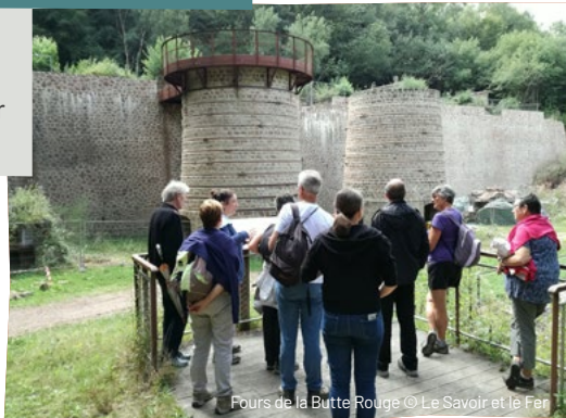
Fours de la Butte Rouge

Tarifs : adultes = 6 € | - 18 ans = 2 € | gratuit - 6 ans