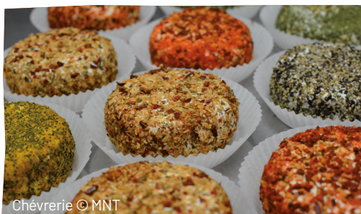
Chèvrerie © MNT

Pour cette dernière de l'année, laissez-vous surprendre par l'équipe de Montagnes de Normandie.