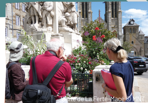
Visite de La Ferté-Macé

Sur les traces du Général de Gaulle en ce jour de l'appel du 18 juin, venu 2 fois à Flers. Le 10 juin 1945, déblayées de leurs gravats, les rues de Flers sont décorées et le 8 juillet 1960 dans un tout autre contexte, celui de la guerre d'Algérie. Rdv à l'Office de Tourisme, bureau de Flers.