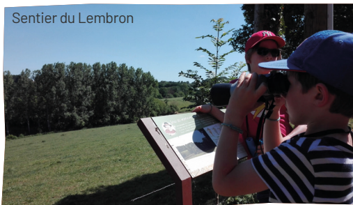
Sentier du Lembron

Circuit de 9,7 km. Parcourez les reliefs accidentés et verdoyants à travers les chemins creux et le long du Lembron, un des affluents de la Rouvre. 2 h 30.