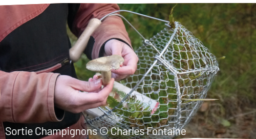
Sortie Champignons