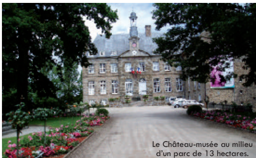
Le Château-musée au milieu d'un parc de 13 hectares.

parking du château rue Richard-Lenoir (balisage jaune).