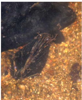
La moule perlière, espèce rare et sensible de la Rouvre

Ces gorges de la Rouvre représentent un terrain de choix pour les kayakistes avertis et pêcheurs de truites sauvages. Mais cet espace naturel sensible de l'Orne est aussi le lieu de passage ou de vie d'espèces animales emblématiques : saumon, loutre ou encore la rare et discrète moule perlière qui peut vivre près de 100 ans enfouie dans les fonds de sables et graviers de la Rouvre.