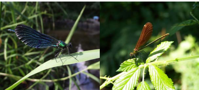
Le Calopteryx (mâle à gauche, femelle à droite) fait apprécier ses couleurs chatoyantes aux nombreux visiteurs du site

Au printemps, le mâle, tout de vert bleuté vêtu s'accouple avec sa femelle aux teintes cuivrées, qui pond ensuite ses œufs parmi les plantes aquatiques s'étalant depuis les berges de la Rouvre. En fait, cet insecte n'arbore ses belles couleurs que quelques semaines, quand il atteint l'âge adulte. Il passe la majorité son existence sous l'eau, à l'état de larve grise et translucide, dissimulé parmi les plantes.