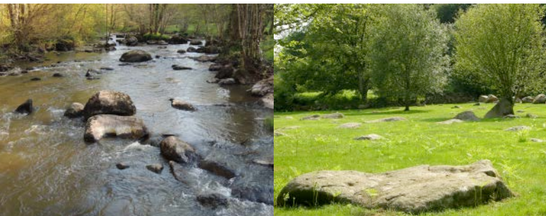
La Rouvre a des allures de petit torrent au «Chant des cailloux»

Le site du «Chant» des cailloux tire son nom des sonorités que laisse échapper la rivière, quand elle vient frapper les pierres et blocs parsemant son lit. Toutefois, il n'est pas rare qu'il soit aussi orthographié «Champ des cailloux», du fait des nombreux affleurements de granite donnant tout son caractère à la prairie principale du site.