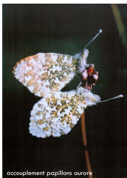
accouplement papillons aurore