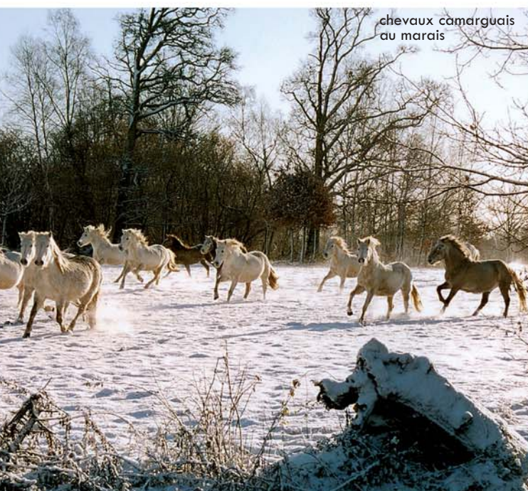
chevaux camarguais au marais