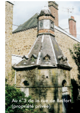
Au n°3 de la rue de Belfort (propriété privée)

2, place du Docteur-Vayssières - Tél: 02 33 65 06 75 accueil@flerstourisme.fr - www.flerstourisme.fr