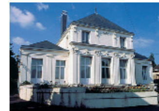
L'ancien Cercle de Flers (actuellement l'ADAPEI)

Le Champ de Foire. Aménagé en 1844, ce lieu attirait les grands rassemblements agricoles et fêtes comme la Saint-Gilles qui subsiste toujours le dernier mercredi d'août. Transformé en 1868 en jardin public aux essences rares, le Champ de foire accueillait la statue du Juif errant de Le Harivel Durocher, ainsi qu'un kiosque à musique provenant de l'Exposition universelle. De belles habitations